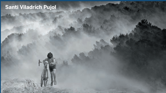
Santi Viladrich Pujol