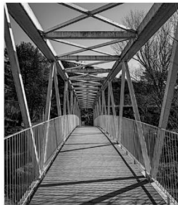
Milor Col·lecció 3er. RAL·LI FOTOGRAFIC “FIRA DE LA CANDELERA” - Autor: Toni Vidal Sanchez -