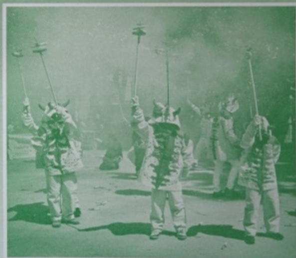
Premi local 2014 Autor: Loli Diaz Sierra; Títol: "Pequeños diablos"

Cornellà de Llobregat (Parc de Can Mercader) 26 d'abril del 2015