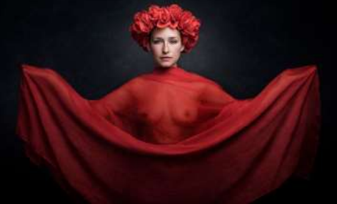
Argazkia: Noe in Red 04 - Manu Barreiro - Beasain, Gipuzkoa