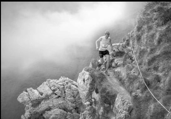
Argazkia: Maratón de Aitzkorri - Miguel Cavero - Ordizia, Gipuzkoa