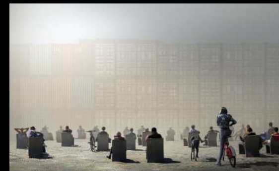
Argazkia: Expectación - Diego Pedra - Cornellà de Llobregat, Barcelona