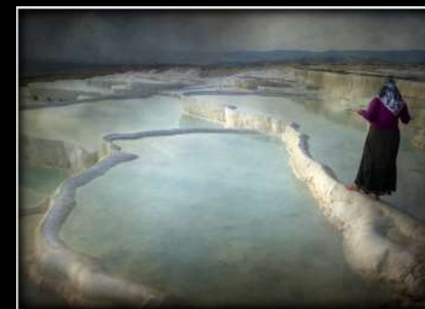
Argazkia: Equilibrio - Andres Indurain - Irun, Gipuzkoa